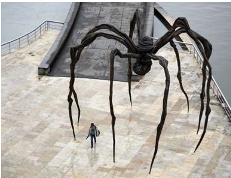
Slika 4. Louise Bourgeois's "Maman", bronza, čelik, Gugenhajn Muzej, Bilbao, Španija

Američka umetnica Luis Bourgeois vidi umetnost kao jedan vid alata za preživljavanjem koji joj pomaže u ličnom egzorcizmu. Stalnim suočavanjem sa svojim podsvesnim sadržajem iz detinjstva umetnica nesvesni strah (fobiju) materijalizuje u monumentalnu skulpturu pauka Maman (slika 4). On simbolično predstavlja njenu majku prema kojoj gaji strahopostovanje usled nesresnog braka sa ocem koji je 10 godina proveo u neverstvu. Iako njena majka znajući za muževljevu dugogodišnju aferu nije reagovala, ona je kod umetnice izazvala nedokučivu sumnju u emotivno vezivanje (Tabela 2. Autonomija vs. Sumnja i sramota). Međutim usled pozivnog razvoja u karijeri i u ljubavnom životu umetnica uspešno prevladava ovu krizu i sama ulazi u brak u kome dobija i potomstvo. Iako njeni radovi ulivaju osećaj nelagode i proispituju naše granice prijatnosti sama umetnica je pokazala da se uspešno izborila sa svojim krizama jer je umesto izloacije izabrala intimnost (slika 1) i time ostavila svoje traume iza sebe u galeriji ili van nje.