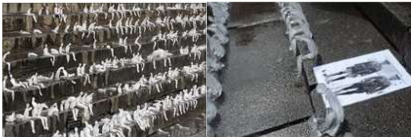
Slika 5. Nele Azevedo , ”Najmanji spomenik”, 2014, zamrznuta voda, led, Birmingen, Engleska

vidimo u projektu “Minimalni spomenik” gde 5000 ledenih ljudskih figura od leda, volonteri nameštaju na stepeniše Čamberlijan trga kao glumce za sceni (slika 5) Međutim umesto glume, prolaznici gledaju kako se figure postepeno tope i nestaju na suncu baš kao i ljudi koji nestaju usled ove pošasti. Kroz ovakve projekte vidimo da ne samo da čovek nije nepropadljiv nego i sama umetnost nije večna. Ona takođe može kao led da se otopi ostavljajući samo toplinu saosećanja kroz sećanje na njeno krhko i trenutno postajanje.