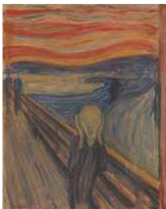
Slika 3. Edvard Munk, "Vrisak", 1893., uljane boje, temera i pastel na kartonu, Nacionalna galerija i Munkov muzej u Oslu

Norveški slikar krhkog zdravlja koji je od malena ostao bez majke i sestre, vodeći bomeski način života u kome nema prave ljubavi osim povremnih avantura u alhoholisanom stanju, biva simbol duševnih bolesti koje bivaju staln pratilac njegovog života. Ovi događaji definišu njegova dela i pretvraju n usamnjenost u depresiju i na kraju očaj (slika 1- Ego integracija vs Očaj).