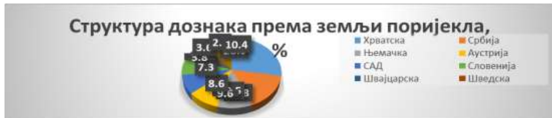
График 1. Структура дознака према земљи поријекла у постотцима (Публикација „Cost of Youth Emigration from Bosnia and Herzegovina“ у издању Westminster Foundation for Democracy [WFD], 2020) Graph 1. Structure of remittances by country of origin in percentages (Publication “Cost of Youth Emigration from Bosnia and Herzegovina” published by the Westminster Foundation for Democracy [WFD], 2020)

износ таквих средстава велики, нарочито због чињенице да 78,6% дознака долази из европских земаља, а 51,1% из Хрватске, Србије и Словеније, што указује да постоје велике могућности достављања средстава неформалним путем. График 1. даје детаљан увид у структуру дознака према земљи пријема исељеника.