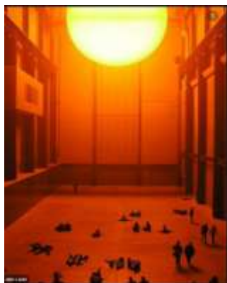
Slika 2. Olafur Eliason, The Weather Project , Tejt Modern, London, 2003

Vreme je bitan faktor u njegovom radu. Umetnik posmatra vreme - vetar, kišu, sunce - jedan od retkih osnovnih susreta sa prirodom koji se još uvek može doživeti u gradu. Zanima ga i kako vreme oblikuje grad, a zauzvrat, kako sam grad postaje filter kroz koji može da doživi vreme. Olafur je rekao „svaki grad posreduje svoje vreme“ . Kao stanovnici, navikli smo na vremenske prilike u gradu. To se događa na brojne načine, na različitim kolektivnim nivoima, u rasponu od posredovanih (ili reprezentativnih) iskustava, poput televizijske vremenske prognoze, do direktnijih i opipljivijih iskustava, poput mokre odeće dok šetate ulicom kišnog dana.