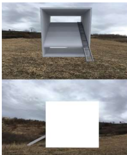
Sli 6 Marija Jevtić Dajić Vizuelni prikaz šeme, projekat Kuća od piksela, 2020

Nivo prostora u ovoj ritualnoj inkluziji je izmešten iz fizičkog prostora i nalazi se na dva druga mesta u isto vreme. Odvija se u virtuelnom svetu kao polazištu njegovog nastanka (vektori i pikseli) i u unutrašnjem svetu aktera - publike kao nosioca i primaoca događaja. Naš um je takođe pod uticajem te smeše, stvaramo oblike i pravimo kontekst i dalji tok koji publika najčešće prihvata kao istinu o svetu.