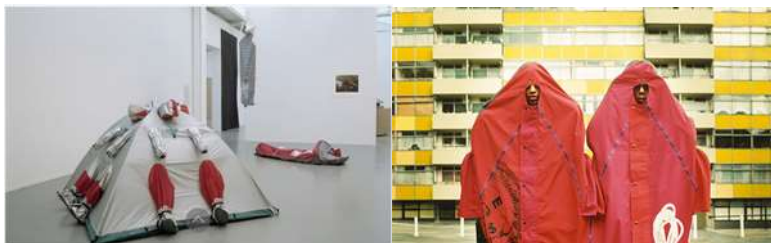
Slika 4. Lusi Orta, Body Architecture, 1998, Kraljevska koledž umetnička galerija, Velika Britanija, 1996. 4b Lusi Orta, Textile and City, Mančester, 2019

Praksa Luci Orte je da istražuje granice između tela i arhitekture, istražujući njihove zajedničke društvene faktore, komunikaciju i identitet. U svom radu koristi medije crtanja, mode, skulpture, performansa, videa i fotografije da bi realizovala jedinstven rad koji uključuje, Arhitekture tela (1992-1998). Projekat podrazumeva prenosive, lagane i autonomne strukture koje postavljaju pitanja mobilnosti i opstanka (slika 4).