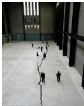
Slika 1. Doris Salsedo, Shibboleth, Tejt Modern, London, 2007

Doris Salsedo je vizuelna umetnica koja je 2007. godine u Tejt Modern (Tejt Modern je nacionalna galerija moderne umetnosti u Londonu) sekla ogromnu pukotinu u podu Turbinske hale (slika 1). Delo Shibboleth je njen komentar o „migraciji, rasizmu, podeli i polarizaciji“ ( https://www.tate.org.uk/visit/tate-modern/turbine-hall ).