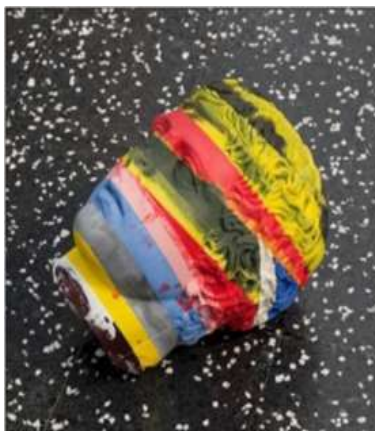
Slika 3. Oliver Larik, Kopienkritik, Basel, 2016 (Fotografija odobrena od autora Olivera Larika)

Austrijski umetnik. Izbor radova uključenih u izložbu Kritika kopija je Larikovo paralelno istraživanje istorije i tehnologije, kombinujući tehnološku osnovu 3D štampanja, zajedno sa umetničkim, formalnim i arheološkim interesovanjima (slika 3). Posebno ga zanima zagrobni život antičkih vremena i kako je to uticalo evropsku kulturu. Digitalne skulpture poput „kopija“ izazivaju pitanja autorstva. Rimski vajari su upravo kopirali grčke i nikada ništa nisu stvorili originalano - samo je jedan od primera koje je on koristio za svoje umetničke argumente (Schielke, 2013).