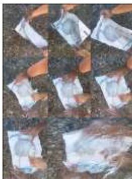
Slika 10. Marija Jevtić Dajić, serija fotografija, Ritualna inkluzija , 2020

To je jedan pogled, jedno tumačenje. Drugi pogled nam prstom upućuje na ritual i na tu zajedničku sponu umetničkih dela nakon tehničke reprodukcije sa pojmom rituala. Ritual je izvođački oblik, koji u našem radu podrazumeva sve prostore izvođenja i sve vidove u umetničkom izražavanju u tom prostoru (slika 10).