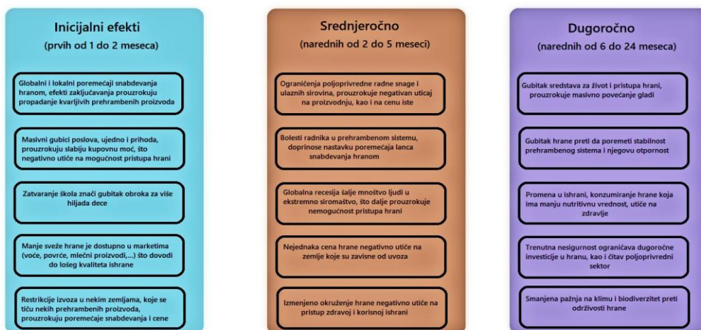
Slika 2: Uticaj pandemije COVID-19 na prehrambene sisteme tokom vremena.