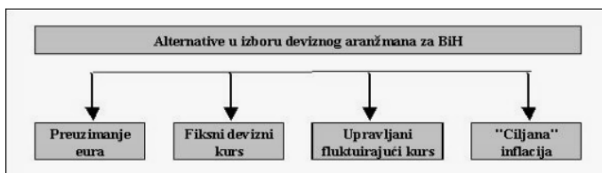
Slika 1. Alternative u izboru deviznog aranžmana za BiH (Krstić, & Sanfey, 2007).