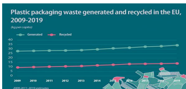
Slika 2. Generisani i reciklirani otpad u EU za period od 2009-2019. godine (Statistics Explained, 2022).

Chart 1. Waste generated by packaging for product packaging in the EU in 2019 (Statistics Explained, 2022).